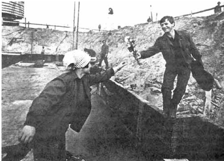
8. März auf einer Baustelle in der DDR

Nach dem 2. Weltkrieg fanden in der sowjetischen Besatzungszone bereits 1946 wieder Feiern zum Frauentag statt. In den sozialistischen Ländern, auch in der DDR, wurde die gesellschaftliche Befreiung der Frau gefeiert. Der Tag wurde mit offiziellen Feiern für die Frauen organisiert, um die sozialen Errungenschaften des Staates für die Frauen herauszustellen.