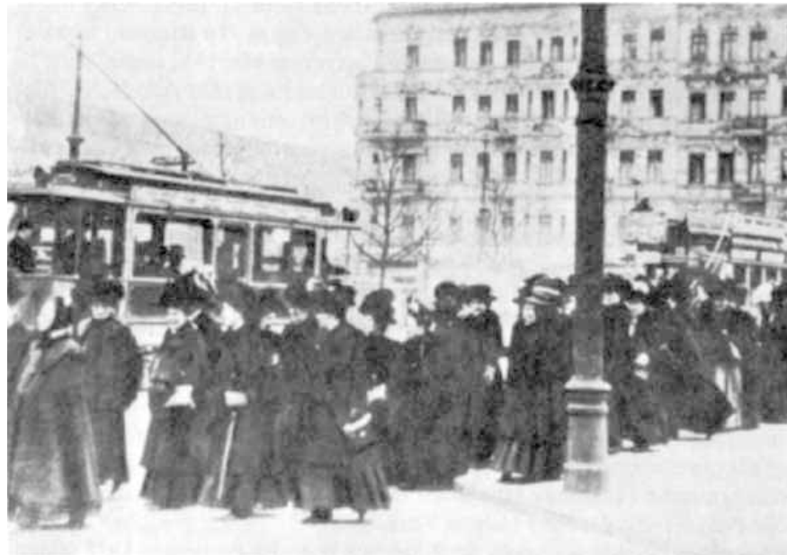
Demonstration zum Internationalen Frauentag in Berlin 1911

Aussage eines männlichen Delegierten der SPD auf dem Parteitag 1913: