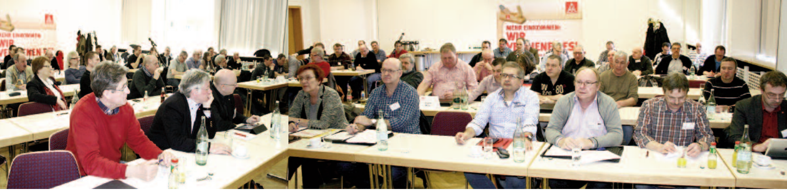
Die Mitglieder der regionalen Verhandlungskommissionen bei der Auftaktkonferenz zur Tarifrunde 2014 für die Holz- und Kunststoffbranchen